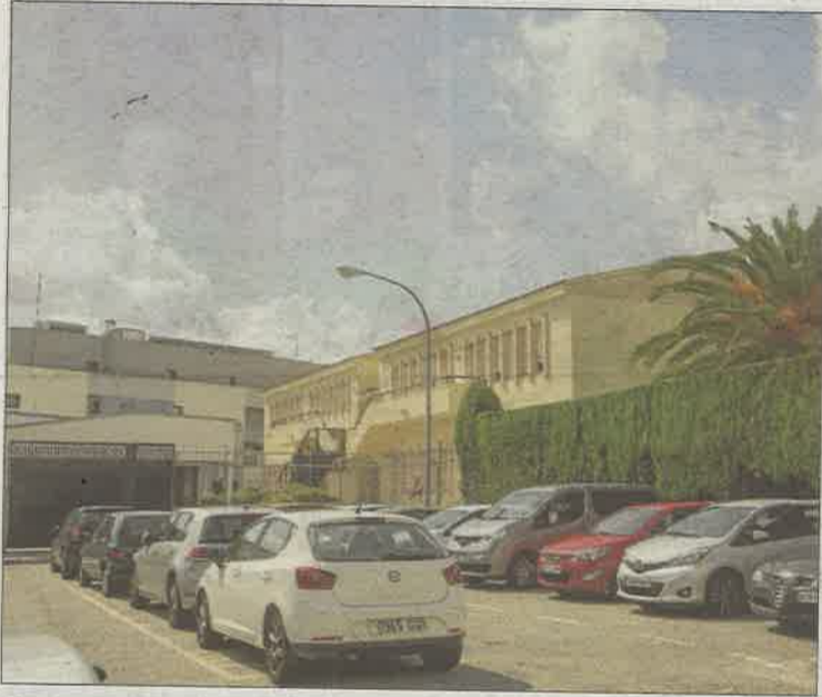
El chico presuntamente acosado acude al colegio El Temple. G. BOSCH

El colegio El Temple es concertado y pertenece a la congregación de las monjas Trinitarias. Desde la dirección del centro explican que conocen el caso y que han seguido el protocolo estable-