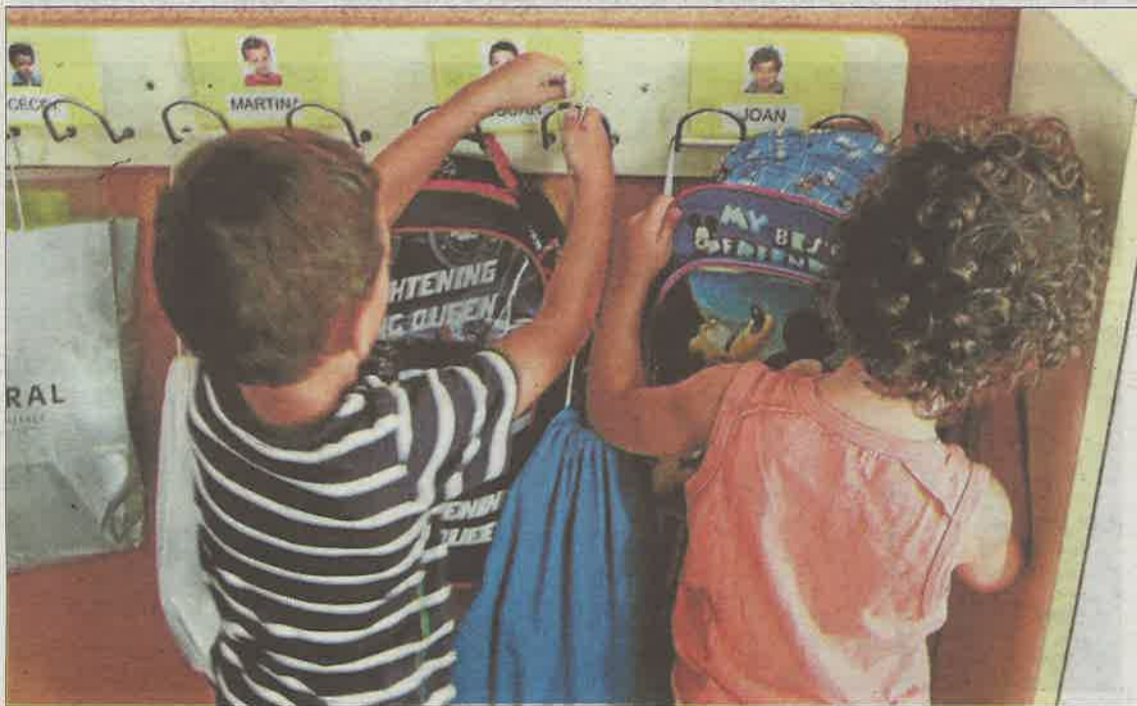
Dos alumnos cuelgan la mochila el primer día de curso. A. JORDI AVELLÀ

Uno de los problemas que se está agravando por culpa de la masificación es la atención a la diversidad.