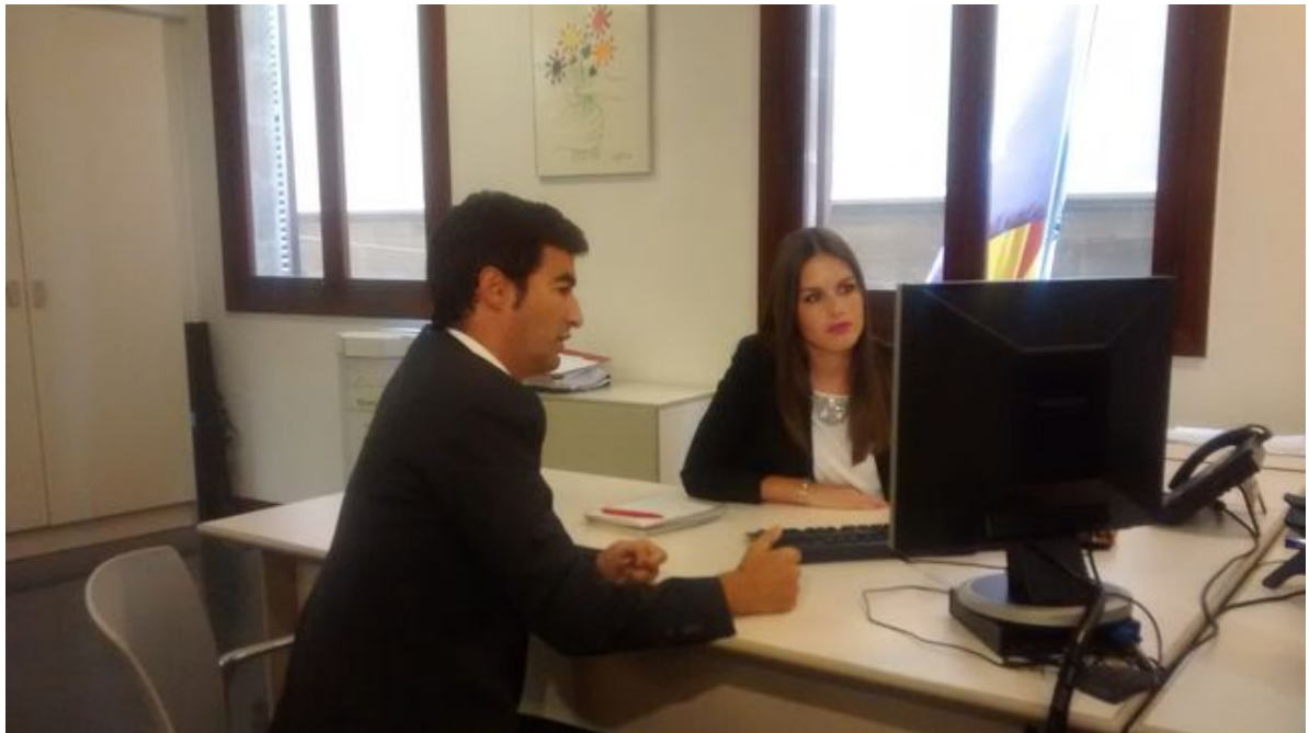
Una alumna d'FP dual realitza la formació a la Cambra de Comerç de Mallorca.

ANNA VIDAL PALMA | ACTUALITZADA EL 18/09/2017 17:59