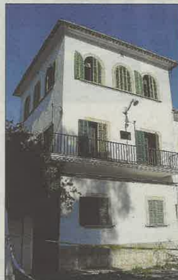
Cuartel de Son Busquets.

■ No se entiende que el proyecto de Son Busquets siga bloqueado, teniendo en cuenta la necesidad de viviendas que hay en Palma. En los 110.865 metros del antiguo cuartel se podrían construir 831 pisos de protección oficial. El Ministerio de Defensa es el propietario del solar y tiene la intención de venderlo; asegura que hay interés en el mismo. De manera incomprensible, el procedimiento urbanístico se está eternizando desde que se firmó el convenio para derribar las viviendas militares del Baluard del Príncep.