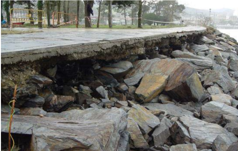
Obra de emergencia en el encauzamiento de la Ría de Navia por daños provocados durante el temporal marítimo en la costa asturiana (febrero de 2017).

El desarrollo del Plan Estratégico Nacional para la Protección de la Costa Española considerando los Efectos del Cambio Climático es una iniciativa financiada por el Programa de Apoyo a las Reformas Estructurales de la Comisión Europea (CE) a petición del Ministerio para la Transición Ecológica y el Reto Demográfico (MITECO), Dirección General de la Costa y el Mar (DGCM).