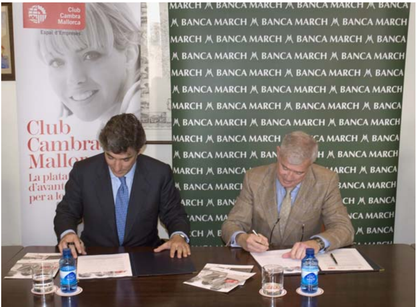
Banca March se convirtió en el primer patrocinador de la nueva Cámara de Mallorca

Otra gran parte de los esfuerzos de la Cámara se ha dirigido hacia la Formación. La Corporación dedica una porción importante de sus recursos a dotar a empresarios y profesionales de las herramientas necesarias para