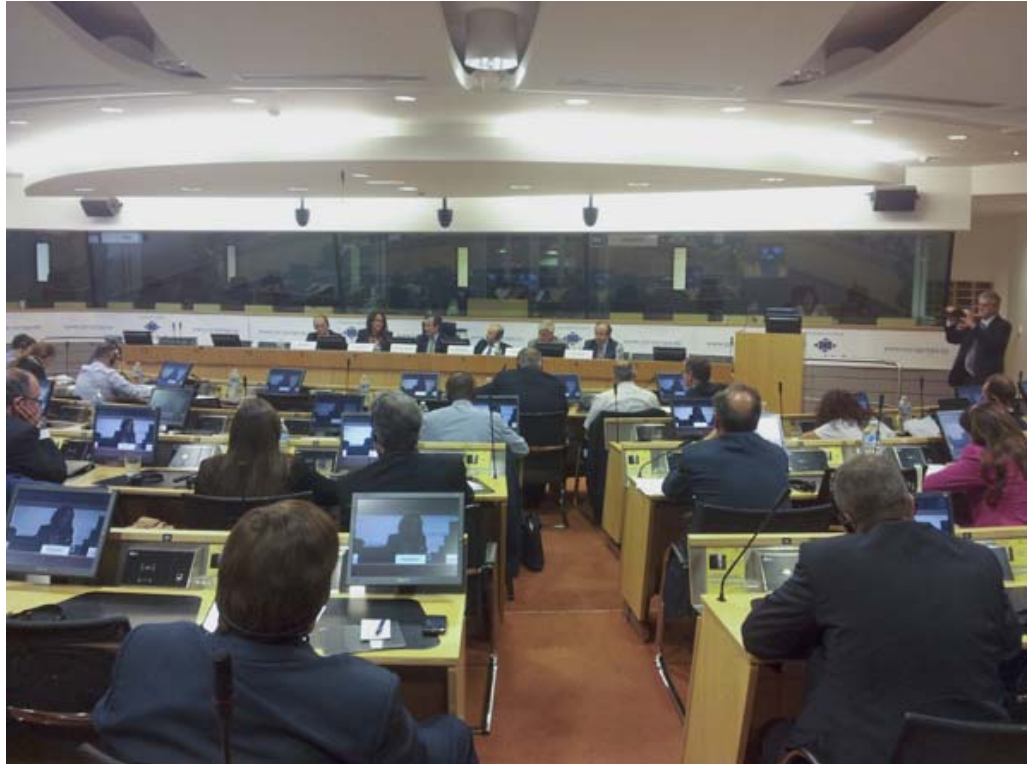
Audición pública sobre emprendimiento insular organizada por Insuleur en Bruselas

Insuleur es la Red de Cámaras de Comercio Insulares de la Unión Europea, cuya presidencia recae en la Cámara de Mallorca desde 2009. Esta organización, reconocida por el Parlamento Europeo, la Comisión Europea y el Comité Económico y Social Europeo, fue constituida en el año 2000 en Quíos (Grecia) para hacer llegar los intereses y necesidades de las empresas insulares a los dirigentes y legisladores europeos.