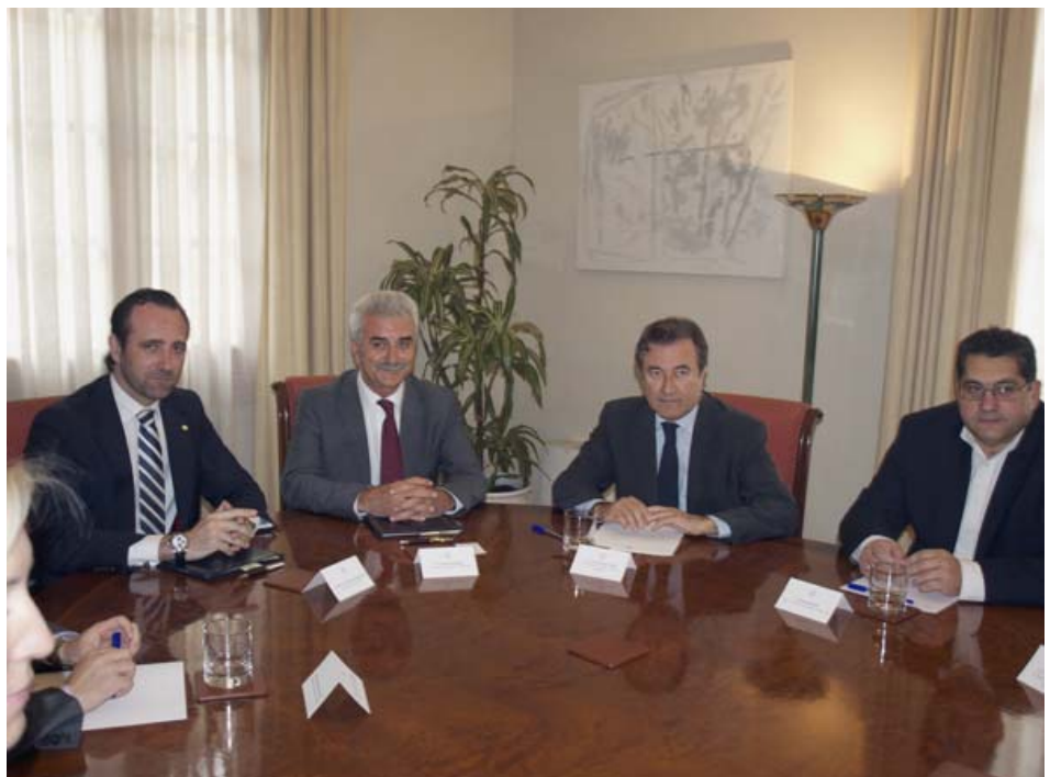
El presidente autonómico recibe a una delegación del Egeo Sur, en su visita organizada por la entidad cameral