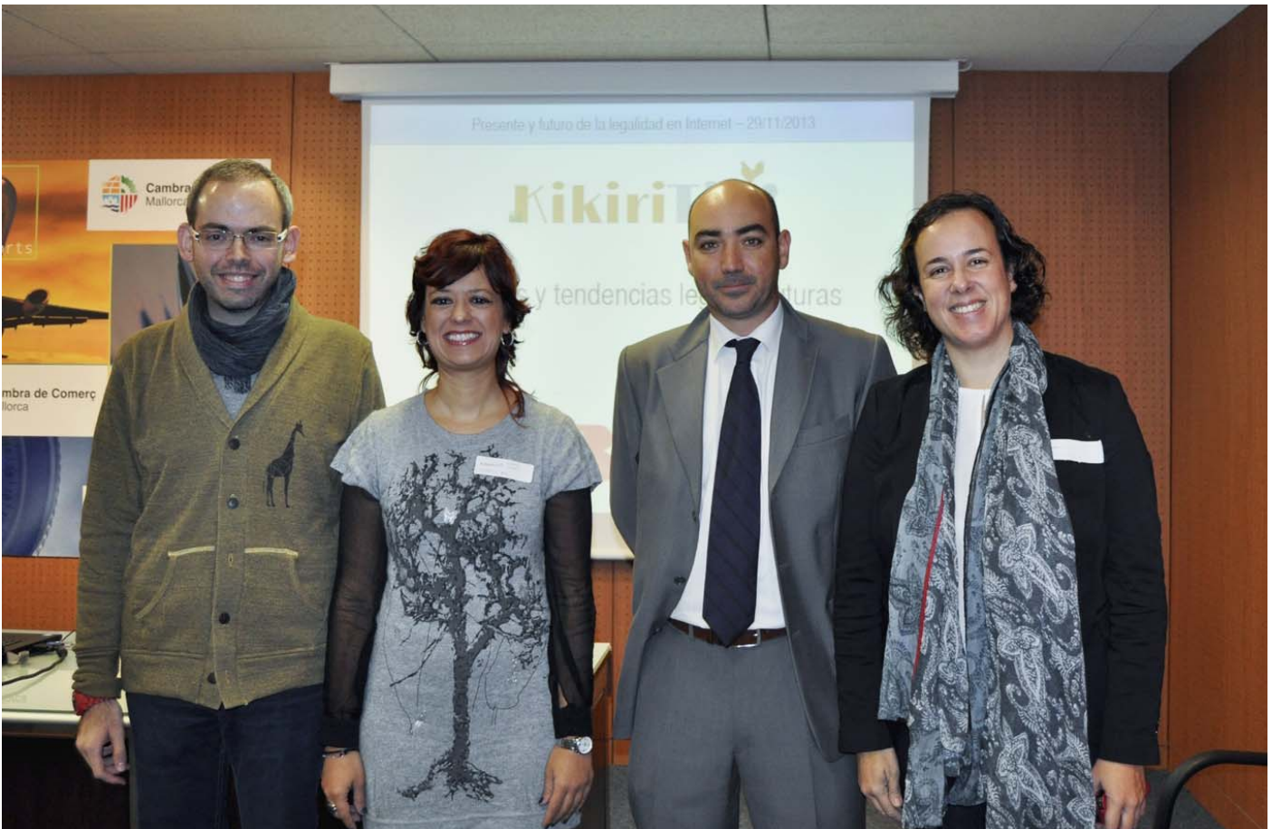
Encuentro tecnológico KikiriTIC, organizado junto a la Fundación Bit

Jornadas KikiriTIC! Programa de charlas tecnológicas organizadas junto a la Fundación Bit, a través del proyecto Dr.TIC de formación y asesoramiento tecnológico, para acercar las nuevas tecnologías al tejido empresarial balear.