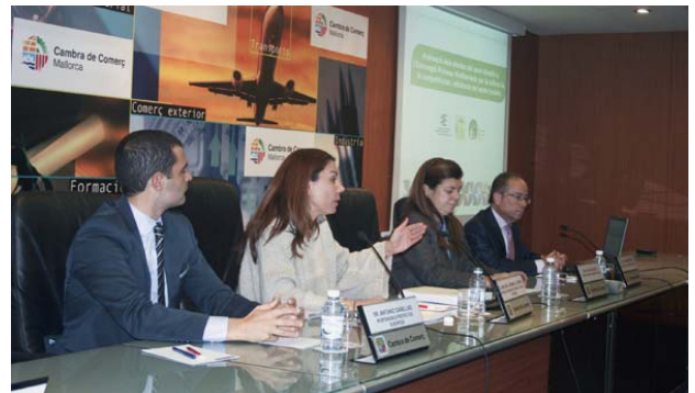
Presentación estudio efectos del cambio climático en el Mediterráneo, de la Fundación Empresa y Clima