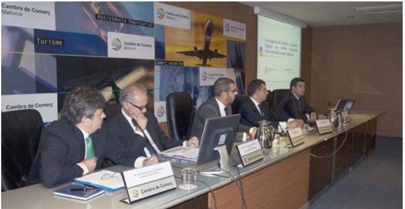
Jornada sobre financiación para empresas insulares

Esta área de la Cámara de Mallorca pretende ser una fuente de información para empresas interesadas en vías alternativas a las líneas de financiación bancaria, tales como financiación pública –Líneas Enisa de impulso financiero a la pyme o Cofides, Compañía Española de Financiación del Desarrollo–, el Mercado Alternativo Bursátil (MAB), la compraventa de empresas, fusiones y adquisiciones, etc.