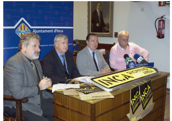
Presentación del proyecto 'Inca Shopping Area' junto a las patronales Afedeco y Pimeco

En 2013, destaca el acuerdo establecido con la Secretaría de Estado de Comercio y el Consejo Superior de Cámaras para desarrollar el “Plan Integral de Apoyo al Comercio Minorista”, del Ministerio de Economía y Competitividad. Así, se ejecuta una serie de acciones para potenciar los pequeños y medianos comercios insulares, en coordinación con la Dirección General de Comercio y Empresa del Govern de les Illes Balears, y con las patronales del sector más representativas, Pimeco y Afedeco, integradas en la Confederación Balear de Comercio.