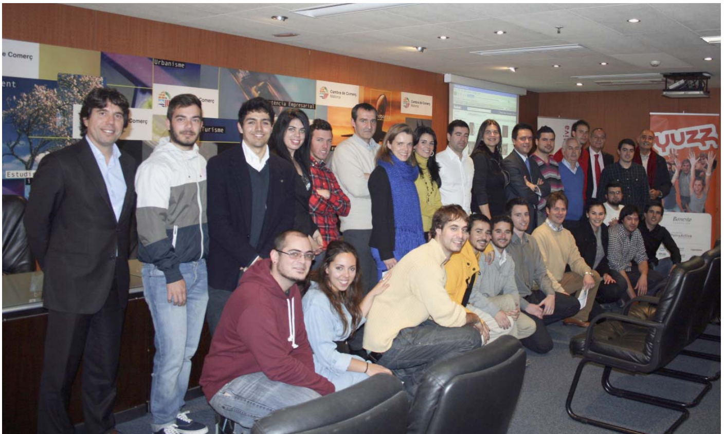
La Cámara colabora en el programa YUZZ para jóvenes emprendedores

Proyecto YUZZ: La Red de mentores de la Cámara tutorizó otros 12 proyectos tecnológicos de jóvenes emprendedores a través de este concurso nacional. Coordinado por Palma Activa (Ayuntamiento de Palma) y lanzado por la Fundación Banesto, promueve el talento de los jóvenes a través de un programa de formación y acompañamiento.