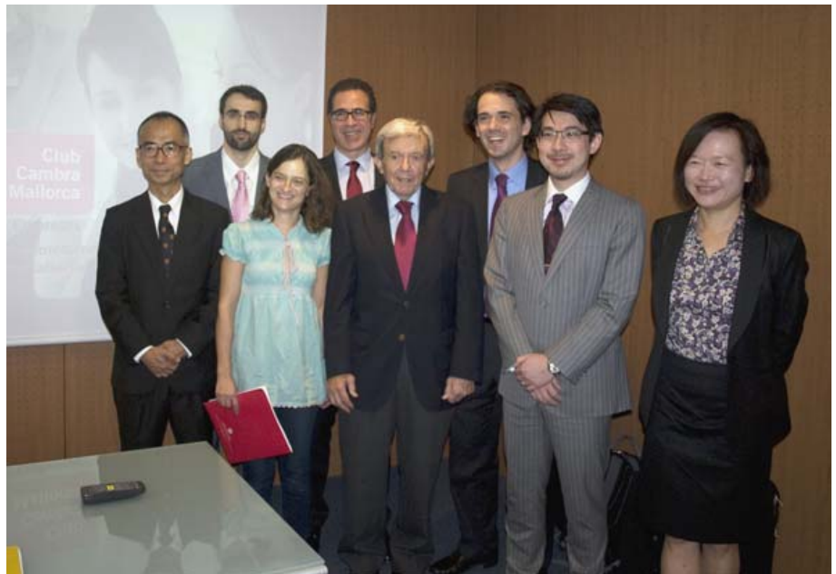
Jornada sobre oportunidades de negocio en Hong Kong, organizada por el Club Cambra Mallorca junto al Cercle d'Economia de Mallorca y TradeWinds