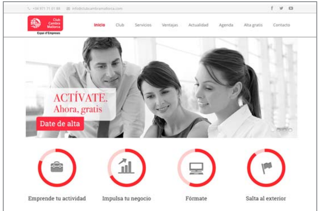
Imágenes de la nueva web del Club Cambra Mallorca, dirigida a ofrecer servicios ventajosos a empresas, autónomos y profesionales

4.000 visualizaciones en YouTube 300 seguidores en LinkedIn