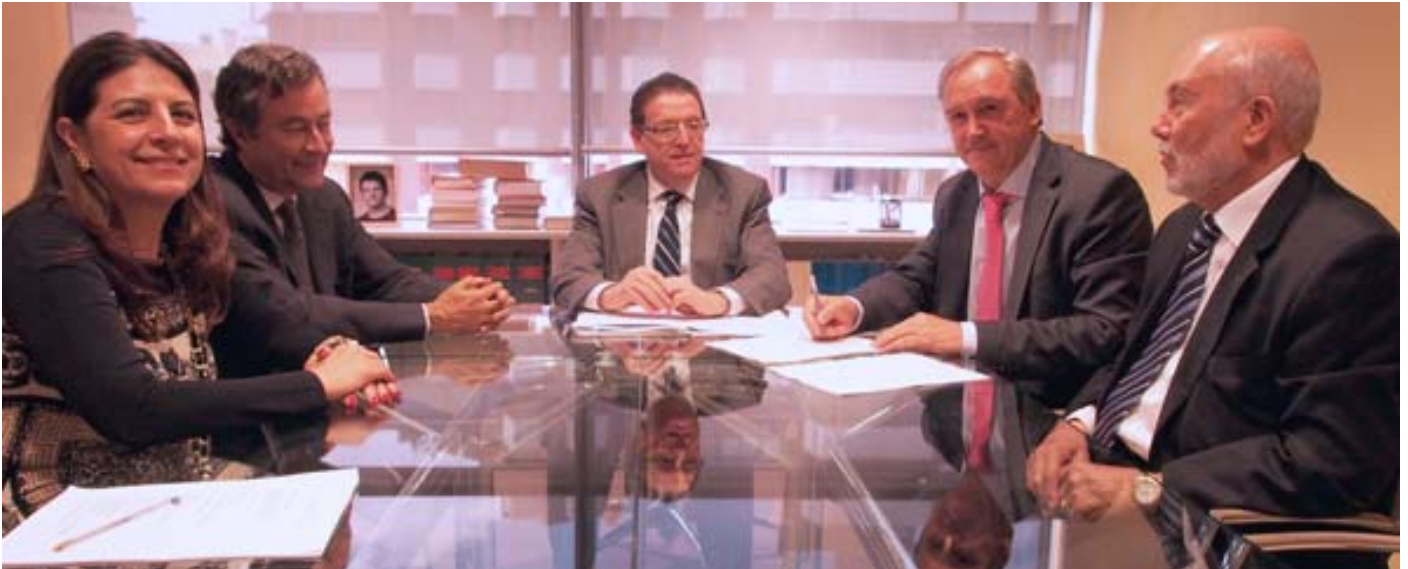
Constitución de la IMIB, impulsada por el ICAIB y las Cámaras de Mallorca y Menorca

La Cámara de Mallorca ofrece los servicios de mediación y arbitraje para la resolución alternativa de conflictos empresariales.