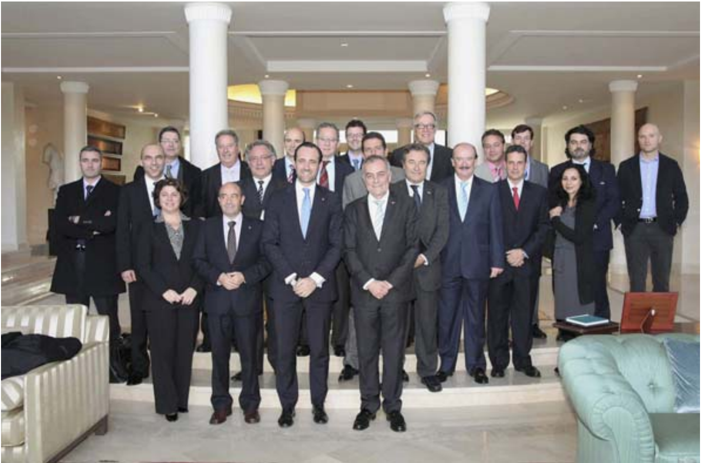
Misión comercial a Marruecos liderada por el Govern Balear y organizada por la Cámara de Mallorca

La Cámara de Mallorca desarrolló, durante el año 2013, una intensa actividad de promoción, información y formación para apoyar a las empresas de la isla en su salida a los mercados internacionales.