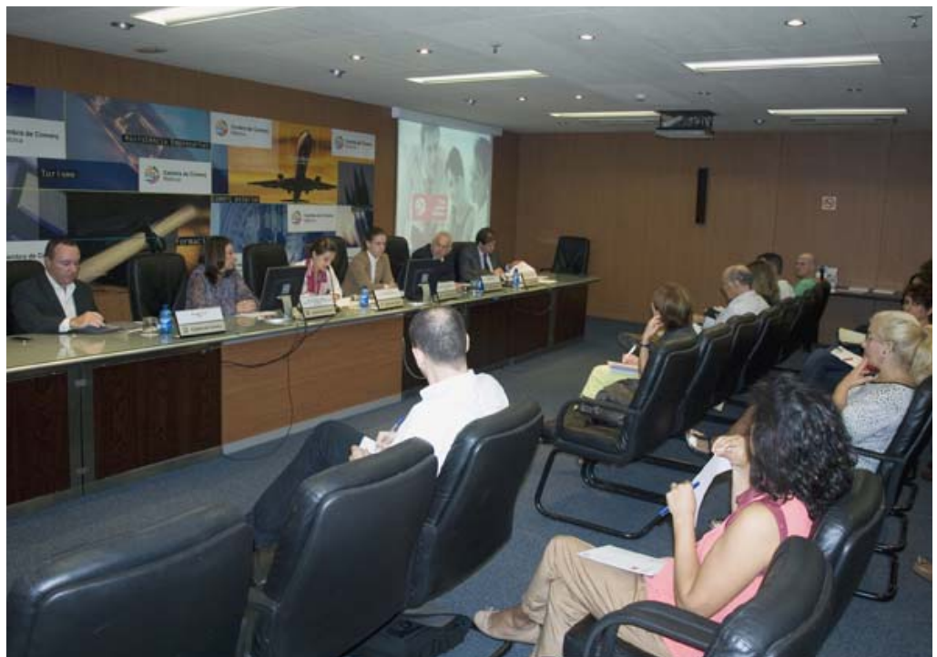
Una de las exitosas jornadas sobre la nueva normativa para emprendedores