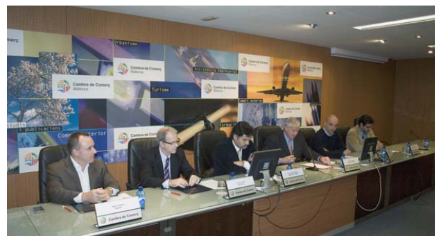
Acuerdo de colaboración con los clústeres de Baleares para impulsar la innovación insular

Contacto: innovacionmallorca@camaras.org