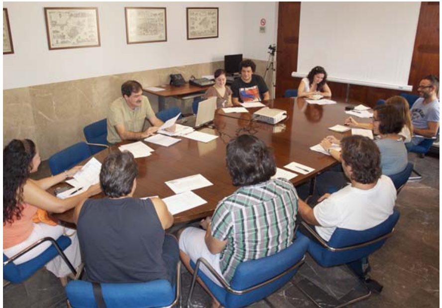
Nuevas sesiones grupales gratuitas para emprendedores cada martes y jueves