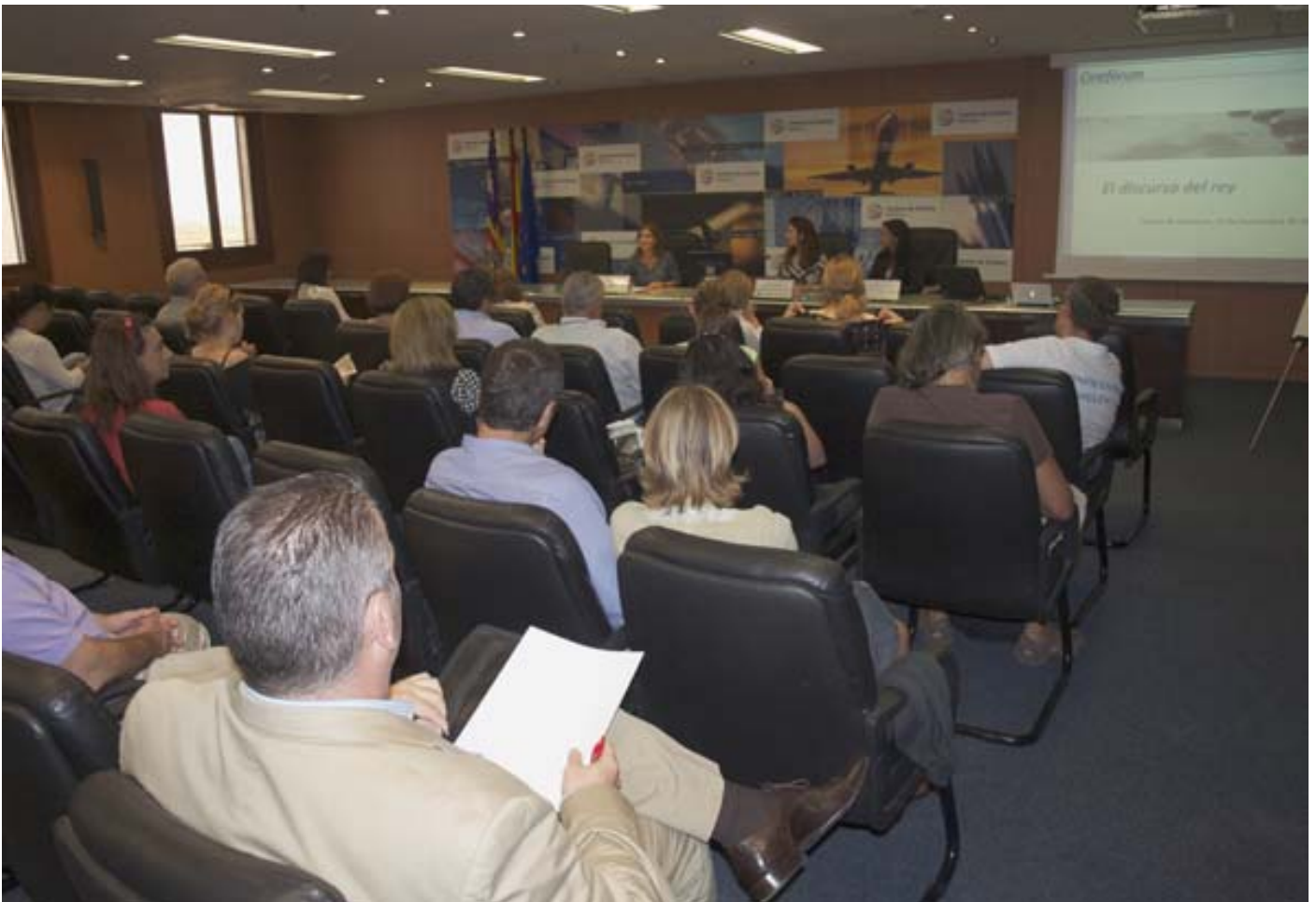
Taller sobre comunicación y liderazgo de la EEC en Mallorca