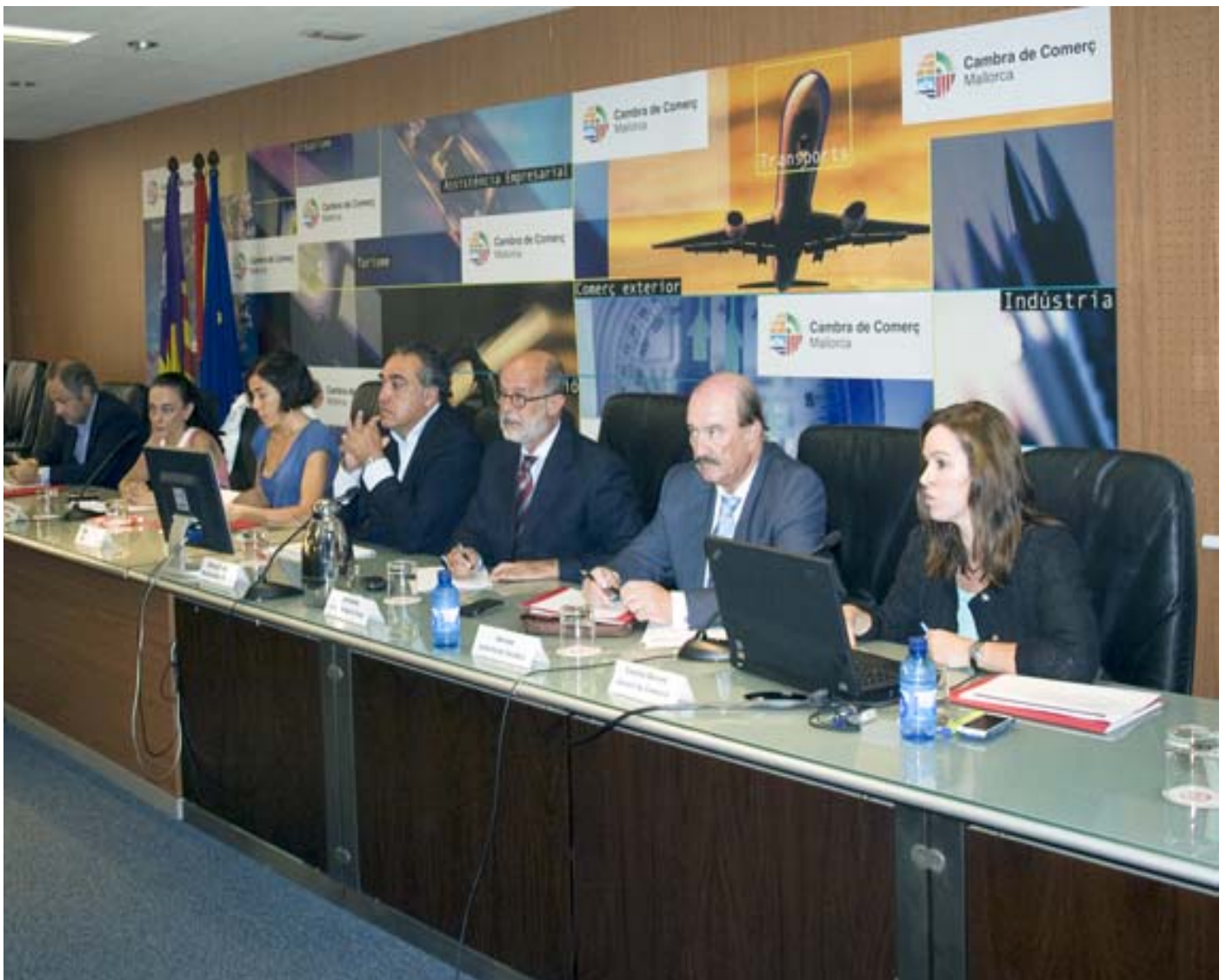
Presentación estudio oferta turística general junto a las patronales del sector

Participación en el Grupo de Trabajo de Financiación, creado por el Govern Balear, al que asisten el Círculo de Economía de Mallorca, el Colegio de Economistas de las Islas Baleares, la Confederación de Asociaciones Empresariales de Baleares (CAEB) y la Asociación de Consumidores de Baleares, entre otros.