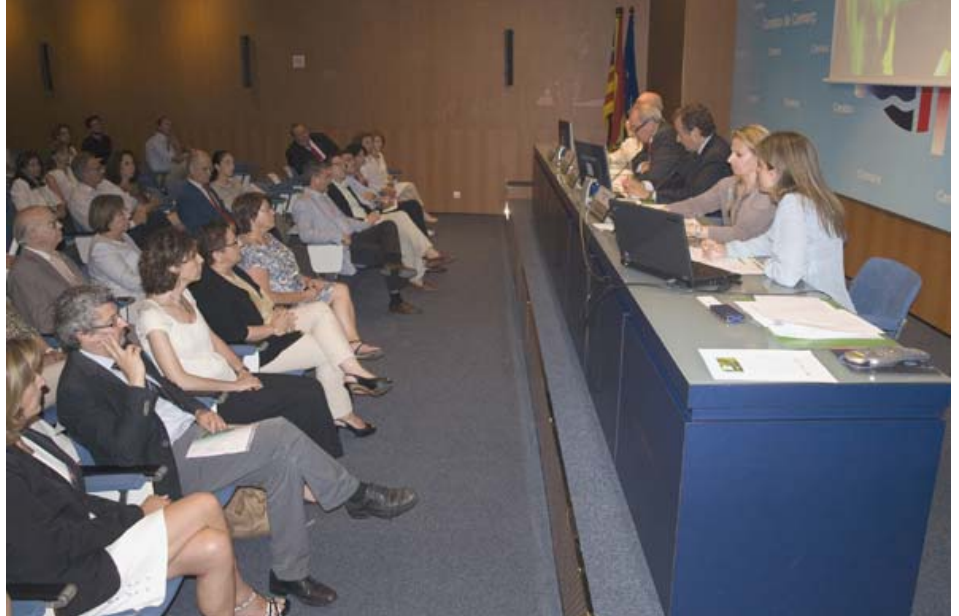
Presentación en sociedad de la IMIB ante un centenar de profesionales

Por otro lado, la Cámara ha participado activamente con el “Punto Neutro para la Promoción de la Mediación” (de GEMME) –iniciativa de colaboración interprofesional impulsada por magistrados pro-mediación– coordinando el grupo de “protocolos de derivación” y organizando diversas reuniones de trabajo en su sede.