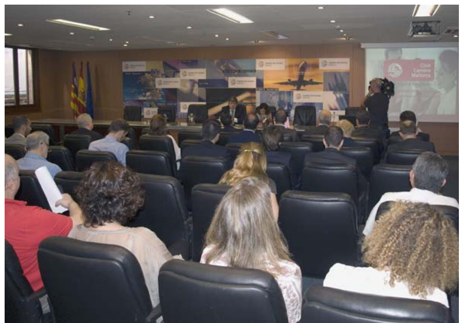
Encuentro organizado por el Club Cambra Mallorca junto a la Fundación Crece+