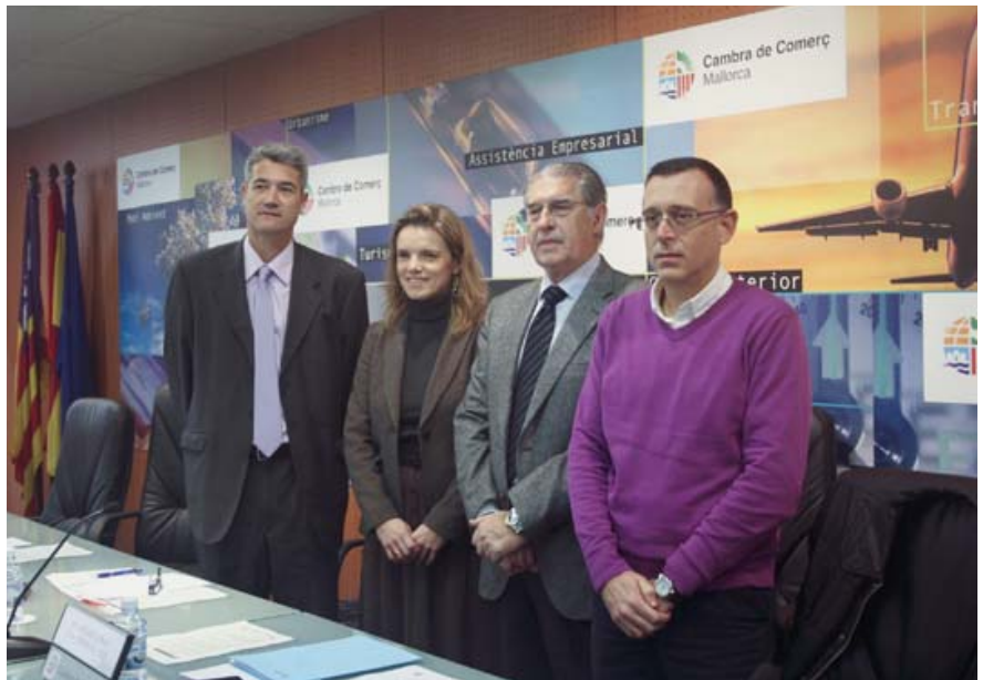
Jornada informativa de la Tesorería General de la Seguridad Social en la Cámara

Desde mediados de 2013, como novedad en la metodología de atención a los emprendedores, además de las consultas sobre formas jurídicas, tramitación para la constitución y puesta en marcha de empresas, subvenciones y líneas de financiación disponibles, gestiones de denominación social, CIF, alta del IAE y de autónomo, se incorporaron las sesiones grupales de orientación para la creación de nuevas empresas y se ofreció un nuevo servicio de tutorización individualizada en la elaboración de los planes de negocio.