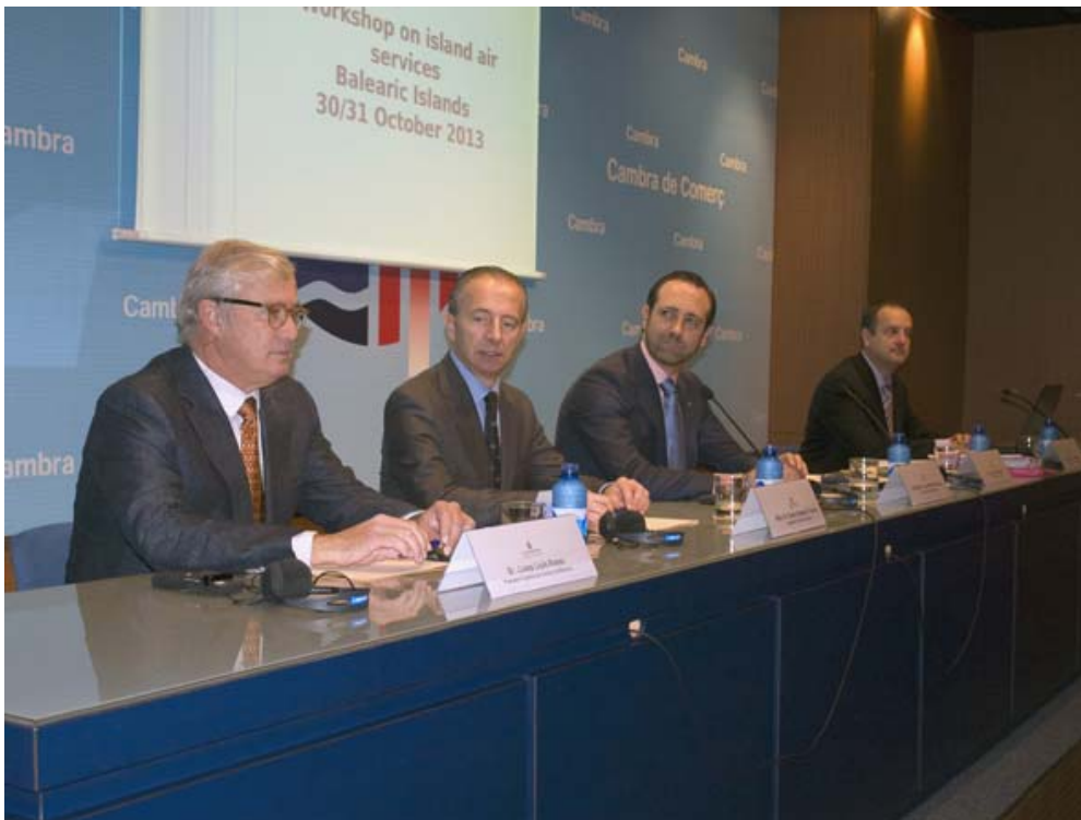
Jornada de la Conferencia de Regiones Periféricas y Marítimas de Europa (CRPM) en la Cámara

adaptarse a la situación socioeconómica del momento. Fruto de ese contacto directo con el sector privado y la responsabilidad de servicio público, la Cámara ha trabajado activamente en la puesta en marcha de la Formación Profesional Dual, una apuesta que pretende acercar el modelo educativo balear al resto de Europa.