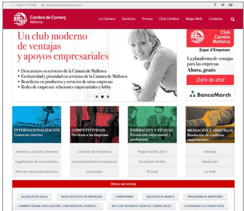
Arriba, la nueva web corporativa de la Cámara de Mallorca, más intuitiva, moderna y cercana, con información clara y de utilidad para empresarios, autónomos y emprendedores. Abajo, imagen del antiguo portal en el que se observa el cambio de imagen.

El departamento ha otorgado, por otra parte, un nuevo aire al ya afianzado boletín digital de la Corporación, 'Infocambra'. Además de la edición semanal que reúne las noticias generadas por la entidad, así como información de interés general para las empresas, se ha creado una newsletter que acerca a la sociedad mallorquina información puntual de las actividades desarrolladas por la Cámara.