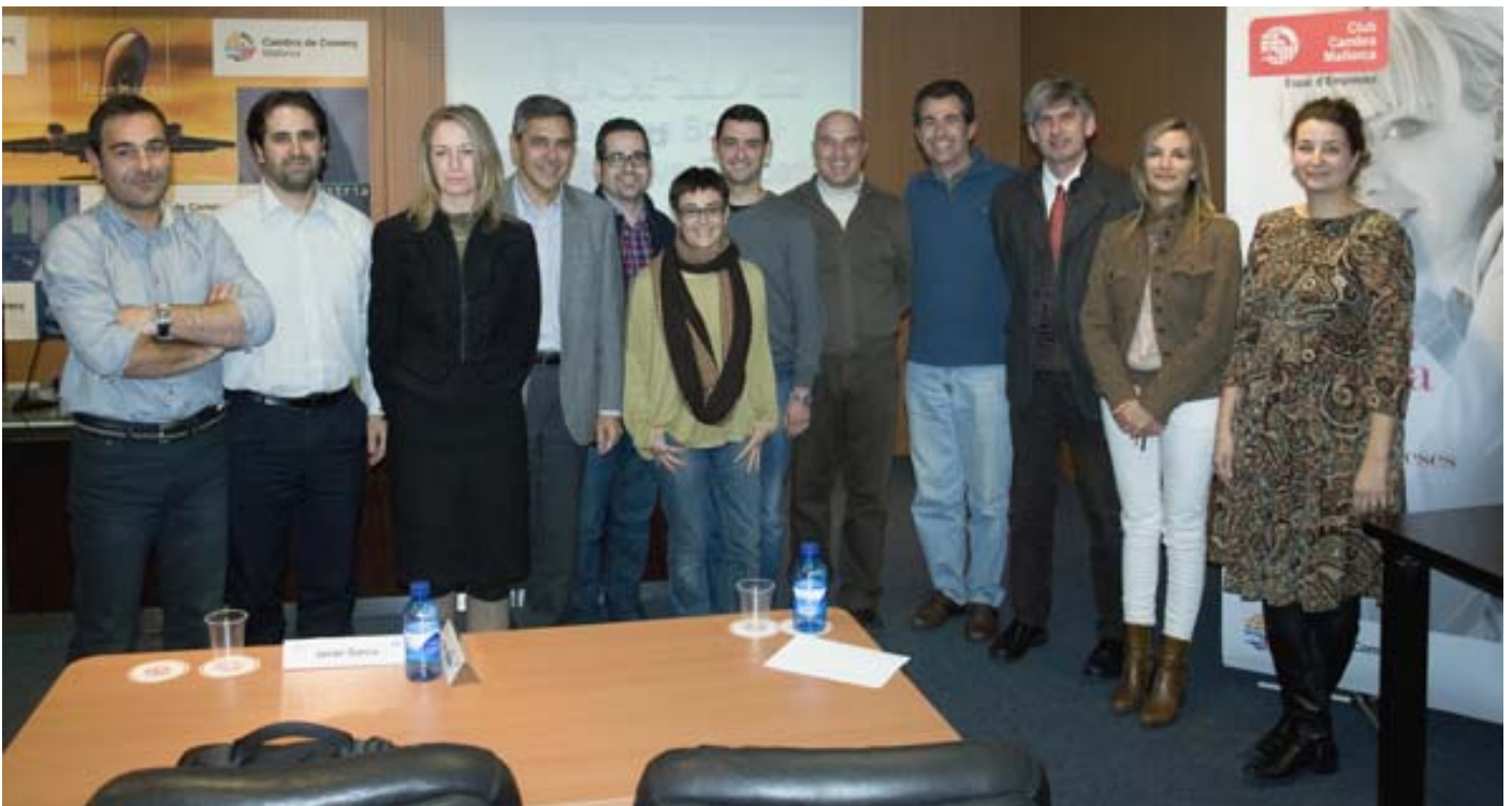
Primer programa de la Escuela de Negocios ESADE organizado junto a la Cámara

En 2013, se han puesto en marcha 48 acciones formativas, de las que se ha beneficiado un total de 713 alumnos.