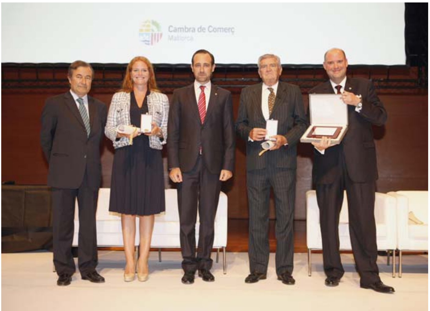
Los premiados en 2013 por la Cámara, junto a Joan Gual de Torrella y el presidente autonómico, José Ramón Bauzá

La Corporación dedica una porción importante de sus recursos a dotar a empresarios y profesionales de las herramientas necesarias para adaptarse a la situación socioeconómica del momento.