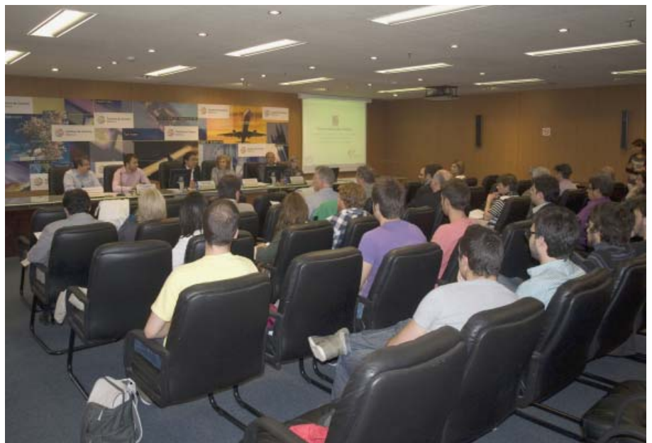
Jornada informativa sobre Formación Profesional Dual

Más de cinco mil organizaciones empresariales fueron informadas sobre la FP Dual, 750 de cuales mantuvieron contacto directo con la Cámara de Mallorca. Un total de 194 se comprometieron formalmente a la contratación de estudiantes.