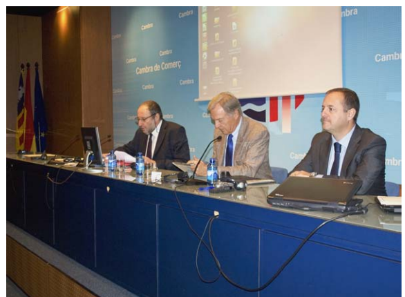
Foro internacional sobre turismo de cruceros celebrado en la Cámara