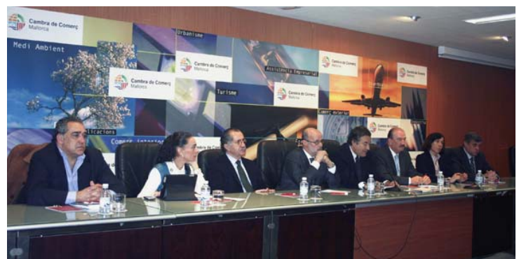
Patronales turísticas de Baleares aúnan esfuerzos contra la estacionalidad insular