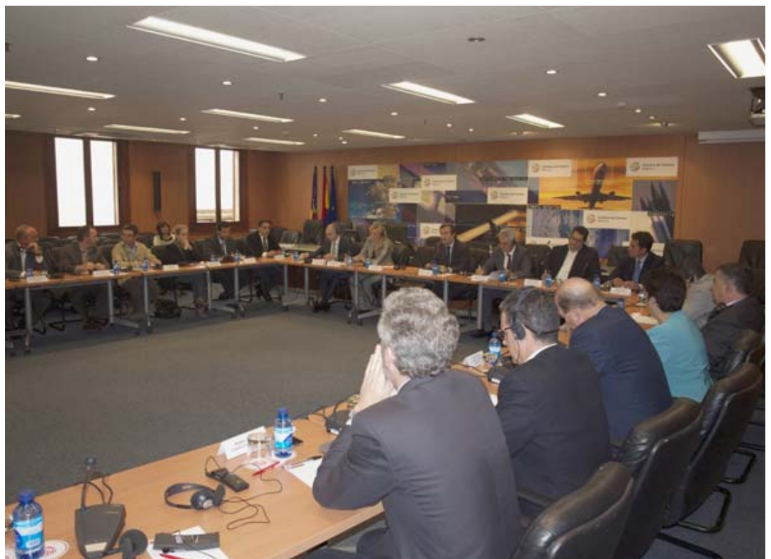
Delegación político-empresarial del Egeo Sur griego visita la isla