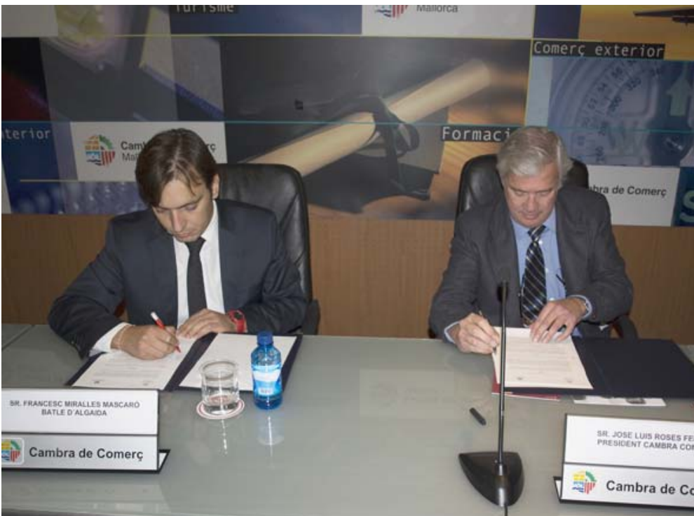
La Cámara y el Ayuntamiento de Algaïda acuerdan la puesta en marcha de un vivero de empresas para emprendedores

La Cámara de Comercio de Mallorca es, además, un modelo de colaboración público-privada con proyección de futuro, a través del cual se defienden los intereses de todos los sectores económicos de la región y se promueven sinergias de colaboración en las principales competencias asignadas por la normativa estatal. Es la Cámara del siglo XXI.