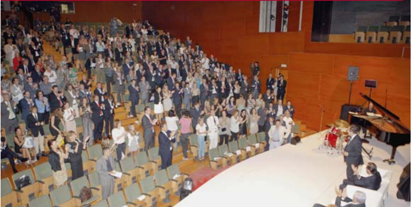
Emotiva ovación a Gual de Torrella al anunciar su dimisión