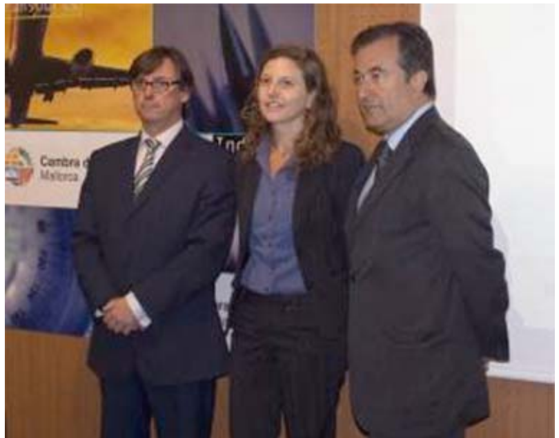
Presentación ICE primer trimestre 2013, junto al Ibestat

A lo largo del año se prepararon dos informes de situación sobre el comercio exterior en Baleares, publicados en detalle por el periódico Última Hora . Se analizaron las exportaciones –clasificadas por capítulos y países– de los principales productos vendidos y el saldo exterior de la Comunidad.